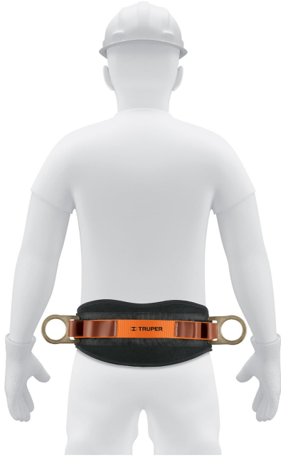
Cinta de poliéster ajustables con hebillas de acero forjado