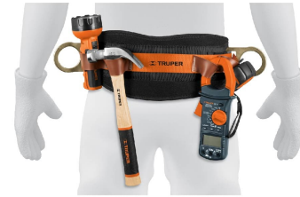
Compartimentos para herramientas